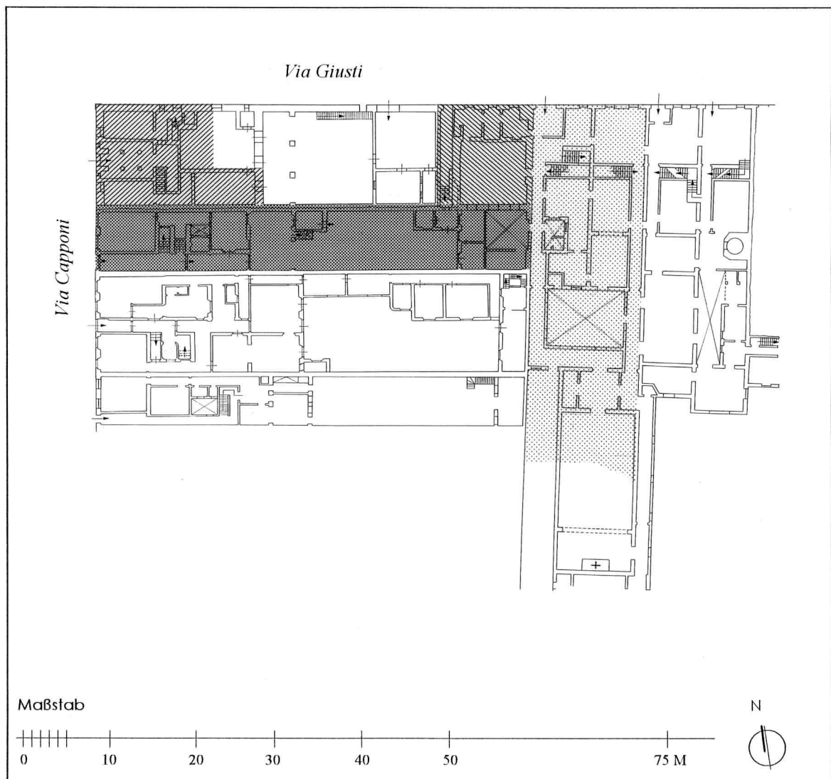
Schemaskizze der Grundstückseinteilung unter Federico Zuccari auf Basis der Grundrißkataster aus den 30er Jahren des 20. Jahrhunderts